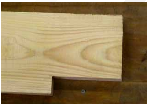
Exempelkapning av virke med jackningssågen