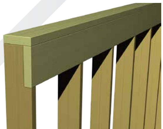
Jackade regler till vägg med stående bärlina